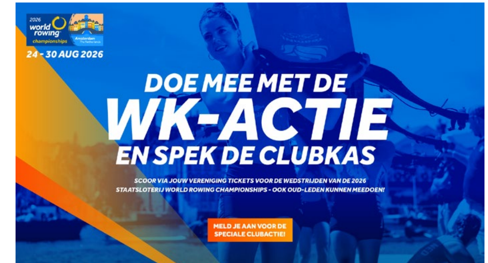
Social post 3:4